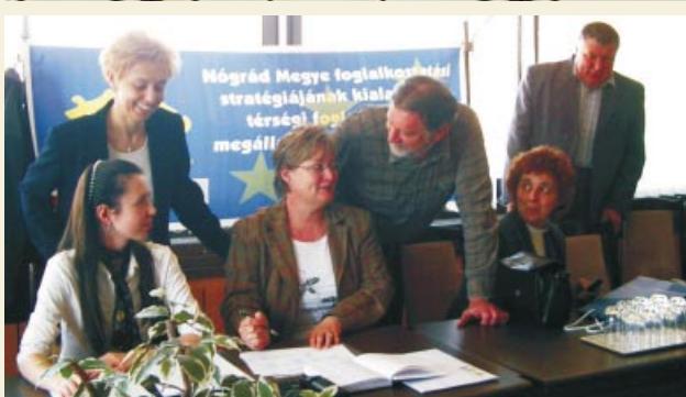
A foglalkoztatási stratégiák kialakításáról vitanapokat tartottak Balassagyarmaton, Pásztón, Szécsényben (képeinken), valamint Rétságon is