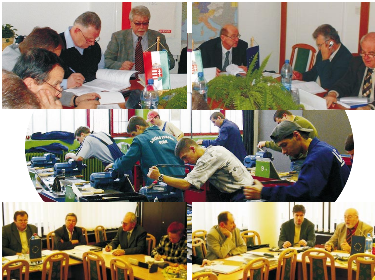
A Nógrád Megyei Munkaügyi Tanács összejövetelein és a Nógrád gazdaságáért ülésein szintén fontos téma a foglalkoztatási stratégia

tő. Az alkotók számítása szerint a maHoln@p program több ezer fiatal számára nyújthat segítséget a pályakezdésben. A középfokú, felsőfokú szakképzésből valamint a felsőoktatásból kilépő fiataloknak ugyanis olyan komplex tananyagot állítottak össze, amely figyelembe veszi, hogy milyen iskolatípusból lépett ki a fiatal. Ez a tananyag négy fő témakörre épül, a munkajog, munkavédelem, munkaerőpiacra történő belépés, valamint az álláskereső kérdéskörét veszi górcső alá. Az elkészült munka az alkotók reményei szerint a jövőben a pályaválasztás, a munkába állás előtt álló fiatalokat segítő szervezeteknek is segítséget nyújt, internetes változatát április elsejétől az év végéig a http://palyakezdo.seagull.hu honlapon a regisztrált látogatóknak ingyenesen a rendelkezésükre bocsátják. A program fejlesztését valamint ingyenes kipróbálását a Foglalkoztatási és Munkaügyi Minisztérium, a Nemzeti Felnőttképzési Intézet, a Nógrád Megyei Munkaügyi Központ és az J. L. Seagull Alapítvány támogatja. A pályakezdő fiatalok munkahelyi beilleszkedését segítő fejlesztő program a szakképzésből, illetve a felsőoktatásból kikerülő fiatalokat kívánja segíteni. A modulonként is igénybe vehető elektronikus tananyagot úgy méretezték, hogy az 260 órában a képernyő előtt töltött időt, a feladatok elvégzésnek időtartamát és a tréningeken való részvétel óraszámát is magában foglalja.