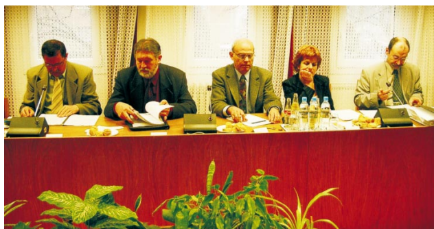
Szakértői csapat elemzi a humán erőforrás fejlettségének változásait

Ebből a hátrányos helyzetből az elmúlt négy évben ugyan valamit sikerült lefaragnunk, de felzárkózni még nem tudtunk. Egy 2005-ös felmérés szerint Nógrádban a 15 éves és idősebb népesség közel kilenczede végezte el legalább az általános iskola 8. évfolyamát, amivel meghaladtuk a régiós átlagot. Továbbá közel öt tized százalékponttal emelkedett a 18 éves és idősebb népesség körében az érettségizettek aránya is (34,8). A régiós (37,5) s az országos átlag (42,6) azonban még mindig magasabb a miénknél.