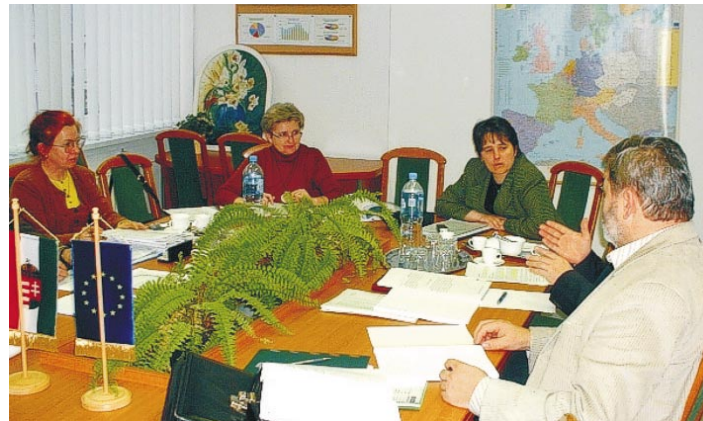
Ülésezik a projektmenedzsment

A Munkaügyi Központ és kirendeltségei szakértelme, a munkaerőpiac részvevőivel, önkormányzatokkal, civil szervezetekkel kiépített és folyamatosan fenntartott